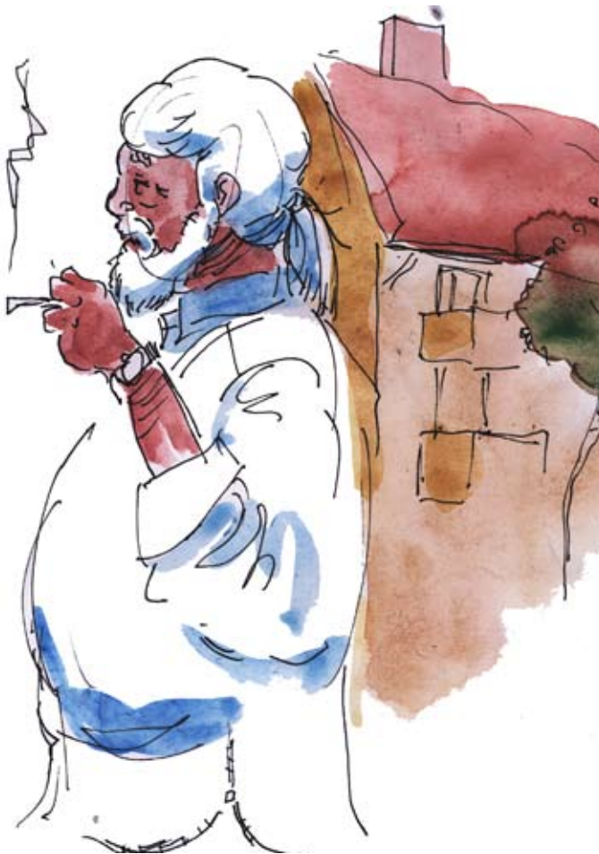
III: Klas Sandberg