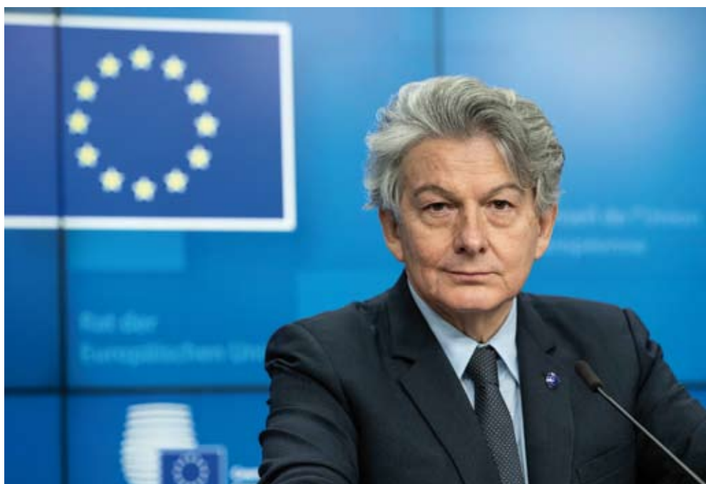
Thierry Breton, Lena Hallengrens räddare. Mannen med de 53 vaccinfabriker.

Antalet anläggningar som arbetade med vaccin i EU området ökade från ett dussintal till 53 stycken. Fabriker byggdes ut i rasande fart. Så skedde med en fabrik i Leiden i Nederländerna för att tillverka de aktiva substanserna. En fabrik i Lonza i Schweiz fick ny produktionslinje. En i Puurs i Belgien likaså. Arbetet inleddes på en jätteanläggning i Marburg i Tyskland med pengar från Tyskland och EU för att tillverka aktiva ingredienser och färdigt vaccin. Fabriken i Marburg beräknas i färdigt skick få en kapacitet på en miljard doser om året. I flera fabriker i Frankrike byggs eller byggs ut av EU och den franska regeringen. Just-in-time konceptet slopades. Istället försökte man låta råvarorna behandlas, renas, vaccinet tillverkas och förpackas i samma anläggning.