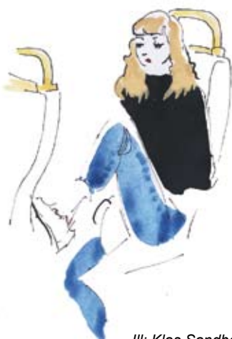
Ill: Klas Sandberg