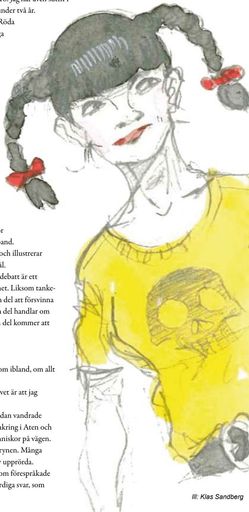
Ill: Klas Sandberg

föredrog ödmjukhet framför tvärsäkerhet, dialog framför övertalning? Som ställde frågor för att vända upp och ned på invanda föreställningar. Som hävdade att det enda han vet är att han ingenting vet.