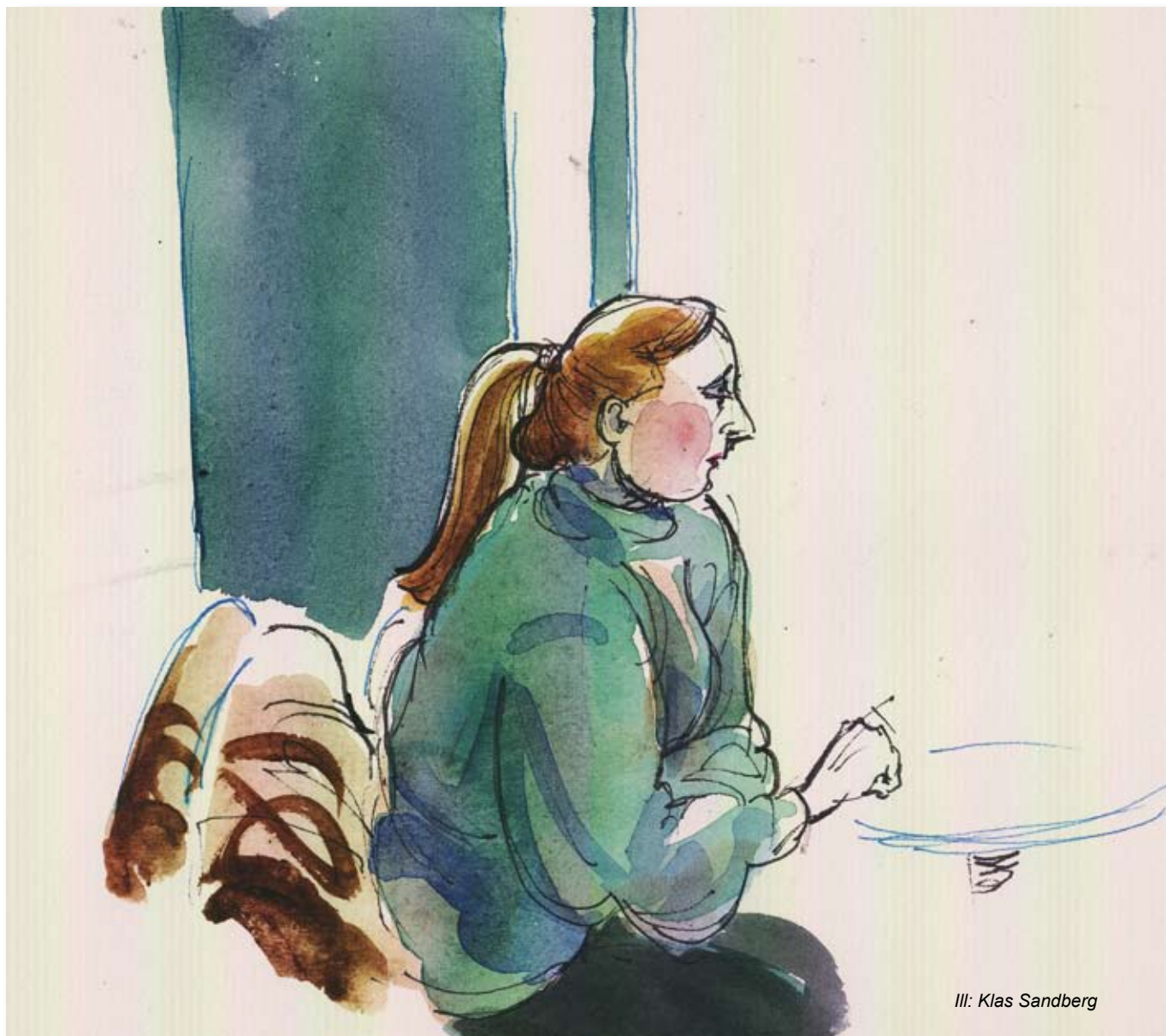
Ill: Klas Sandberg