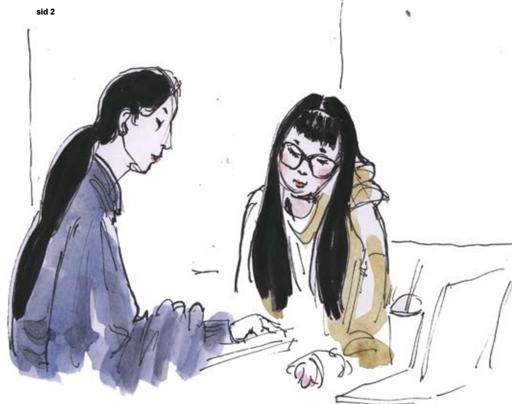
Ill: Klas Sandberg