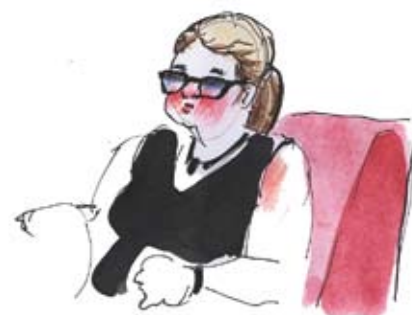
Ill: Klas Sandberg