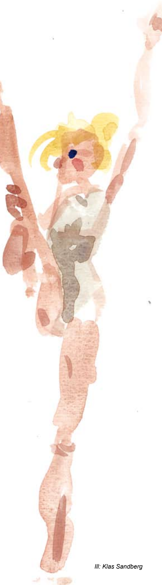
Ill: Klas Sandberg