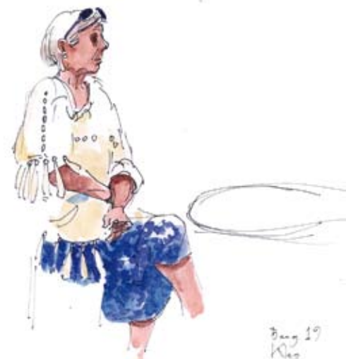
Bengt 19 Klas