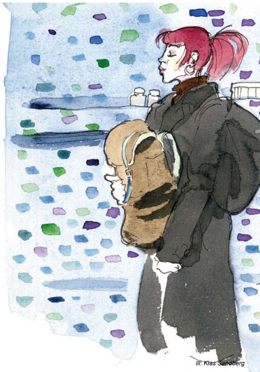
Ill.: Klas Sandberg

Men allra viktigast är att alla tusentals vanliga medlemmar känner kraften av att mötas i diskussionen och utveckla Stockholmsvänstern tillsammans.