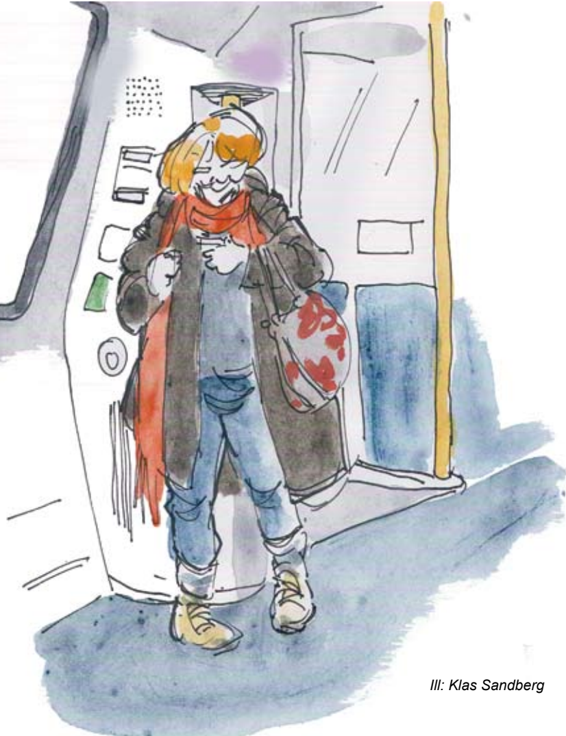
Ill: Klas Sandberg