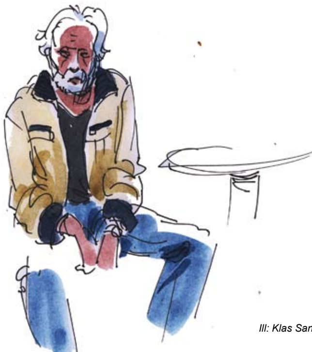
Ill: Klas Sandberg