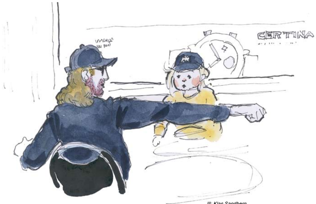
III: Klas Sandberg

Arrangör: Vänsterpartiets pensionärsförening Nyfiken Grå