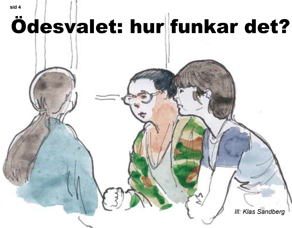
Ill: Klas Sandberg

E n instruktion till EU-valet 2019 för dig som förstagsängsväljare eller erfaren äldre men som egentligen inte har en aning om vafan EU är.