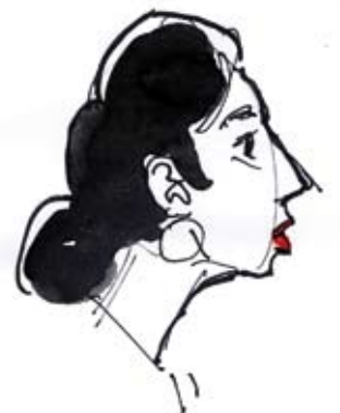
Ill: Klas Sandberg