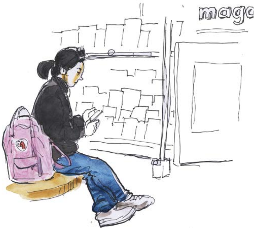
Ill: Klas Sandberg