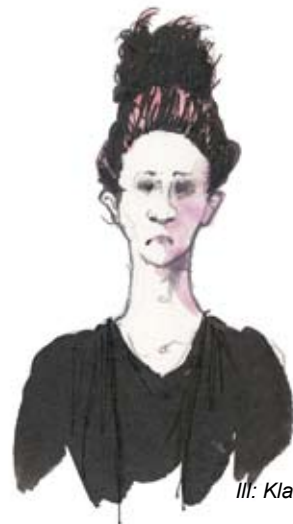
Ill: Klas Sandberg