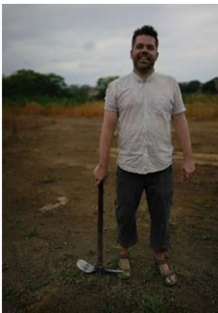
Martin Löf i Venezuela

J ag var i Venezuela på semester mellan 20 april och 6 maj 2019. Tiden tillbringades dels i huvudstaden Caracas och reste jag runt några dagar. Venezuela går igenom en omfattande ekonomisk kris som präglar landet på olika sätt, ett av problemen är hyperinflation. Vilket innebär att priserna ökar ständigt, på en vecka eller en dag kan priset förändras. Det finns mat och produkter i butikerna men till priser som många inte har råd att betala. Inkomster går inte ihop med priserna. Trots detta pågår en vardag och det är vad jag upplevt överlag lugnt.