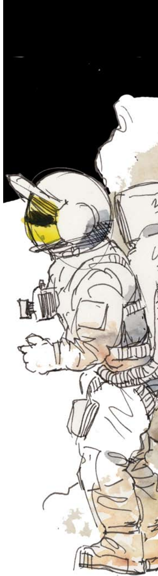
Ill: Klas Sandberg