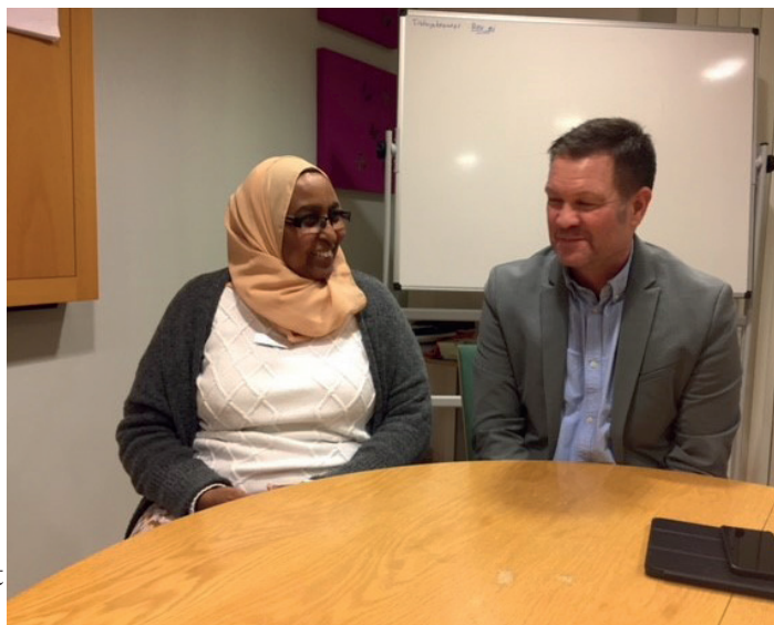
På Praktikertjänst i Järva.