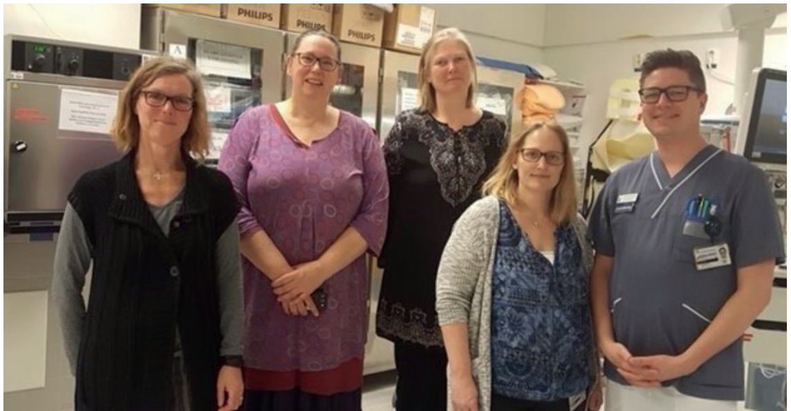
På Akutmottagningen i Huddinge.