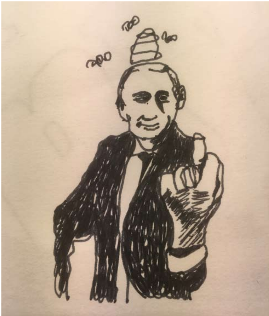
Ill: Johan Norlin