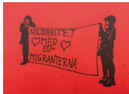
Ill: Johan Norlin