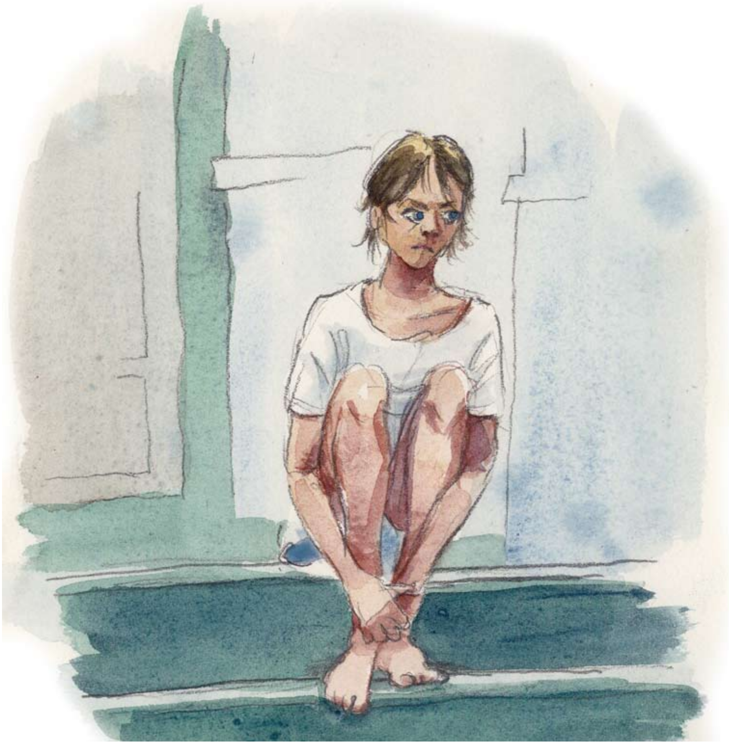
III: Klas Sandberg