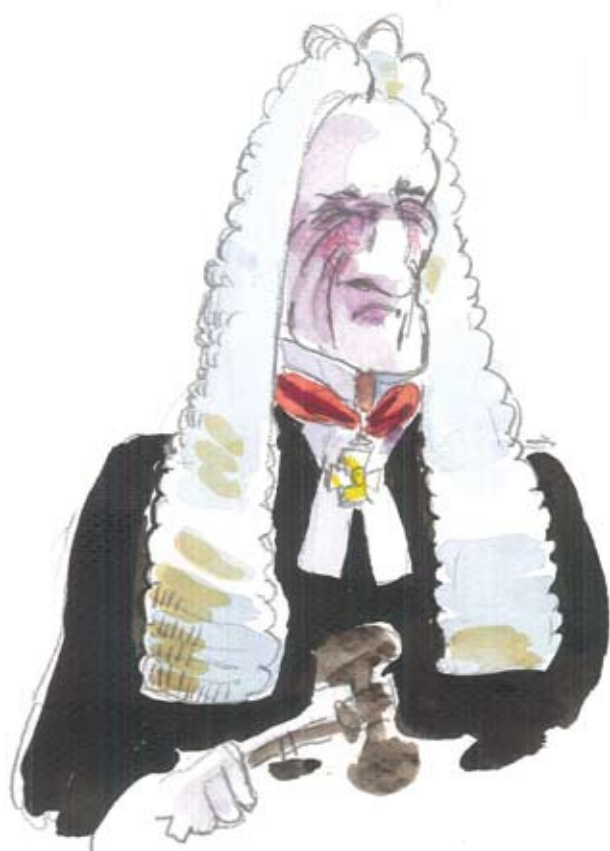
Ill: Klas Sandberg