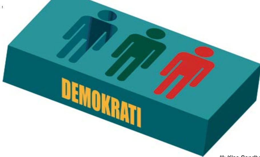
Ill: Klas Sandberg