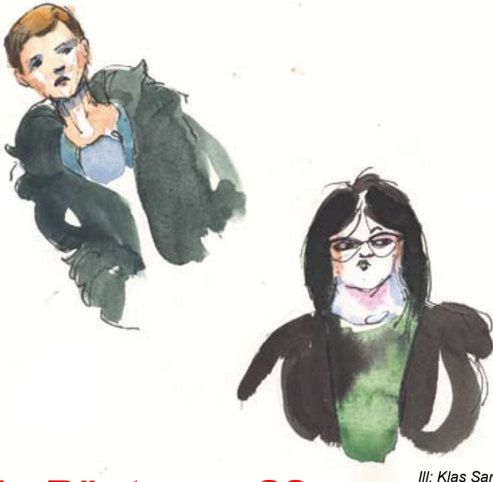
Ill: Klas Sandberg