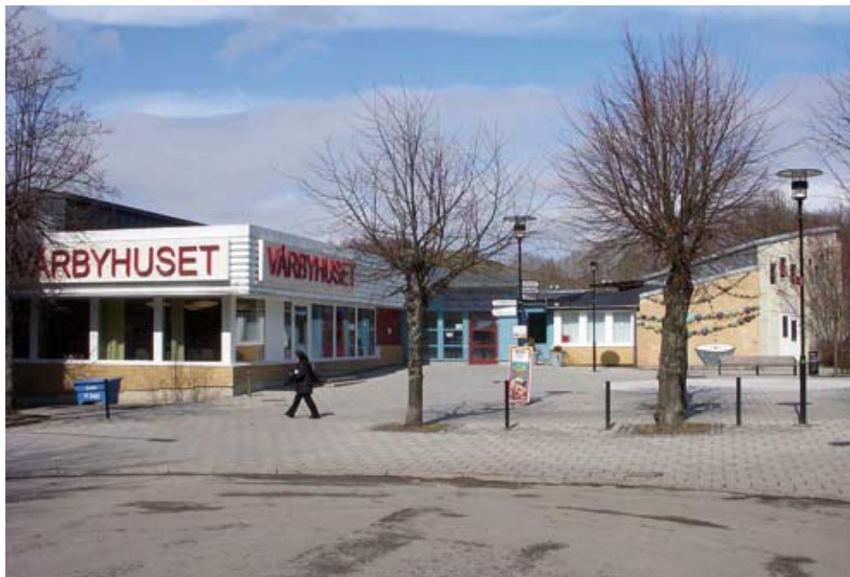
Vårbyhuset