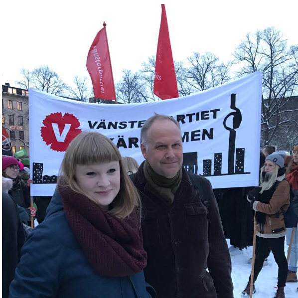
Internationella kvinnodagen 2017