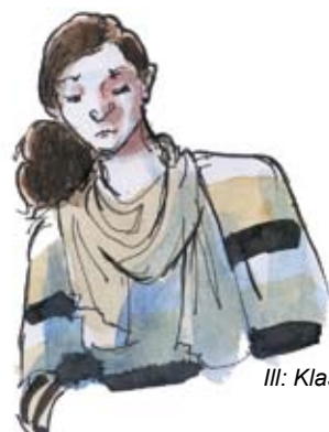
Ill: Klas Sandberg