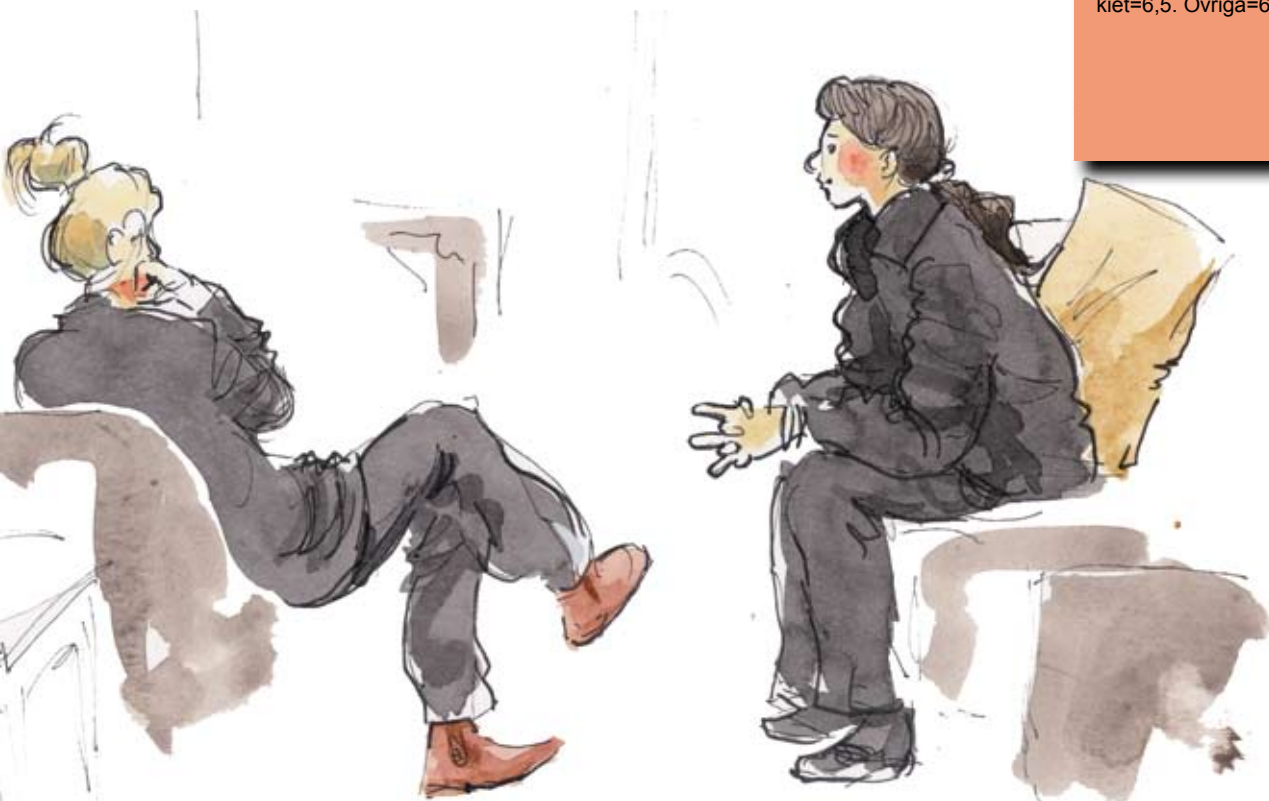
Ill: Klas Sandberg

Irak=6,9. Somalia=8,7. Iran=7,2. Turkiet=6,5. Övriga=6,9. Genomsnitt=6,7.