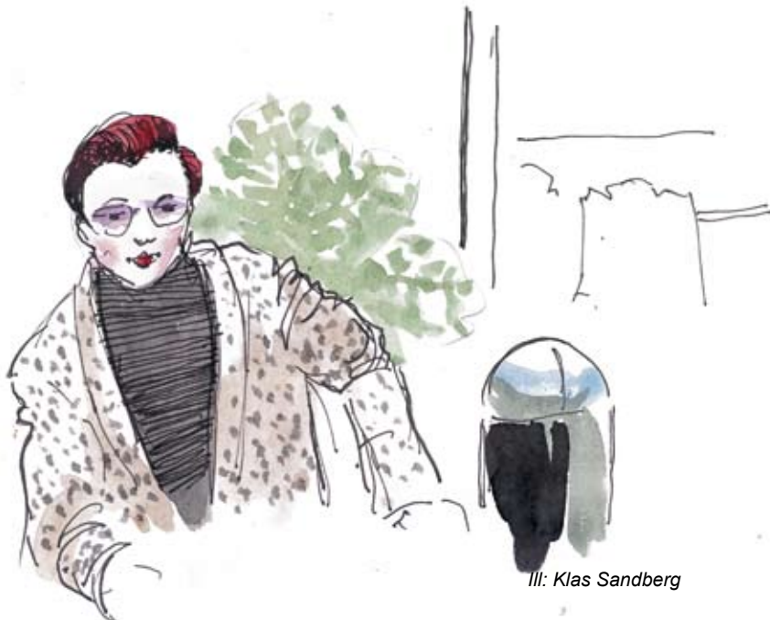
Ill: Klas Sandberg