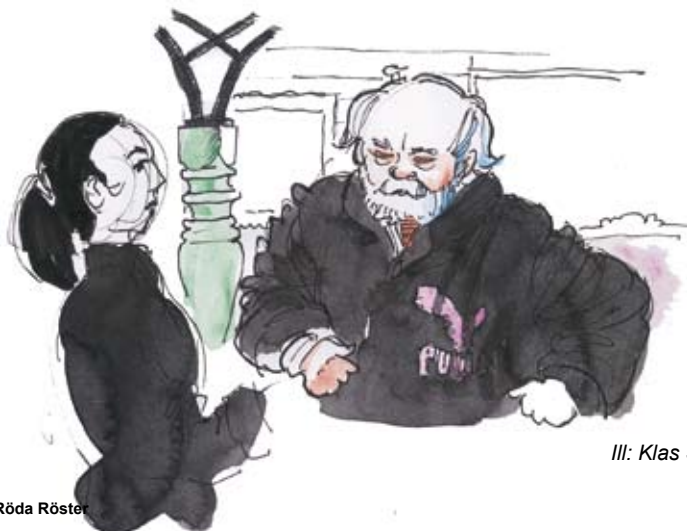
Ill: Klas Sandberg

http://storstockholm.vansterpartiet.se/files/2019/02/DÅK-2019-A-Motioner-och-motionssvar.pdf