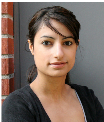
Nooshi Dadgostar Botkyrka