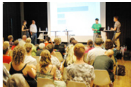
Vårt seminarium med titeln »Myten om de rosa pengarna« var välbesökt.