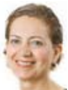
Naile Aras Politisk sekreterare med administrativa uppgifter Övergripande ansvar för

marknadsnämnd, ekonomiutskottet E-post: karin.ragsjo@stockholm.se Telefon: 08-508 29 155 Mobil: 070 216 07 61